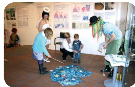
Výlov vánočních kapříků s vodníkem

■ Text: Lenka Suchomelová