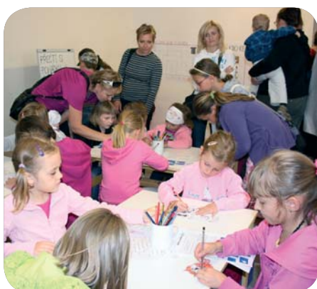
Foto: archiv Dobrovických muzeí. Nahoře slavnostní otevření výstavy strašidel a pohádkových bytostí s oživlými strašidly; uprostřed vystoupení seniorské kapely na Cukrových slavnostech; dole pohádková dílna doplňující výstavu strašidel a pohádkových bytostí