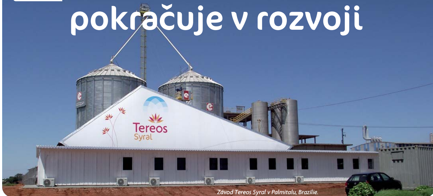
Závod Tereos Syral v Palmítalu, Brazílie.

Společnost Tereos Internacional, kotovaná na burze v Sao Paulu od srpna 2012, v nedávné době učinila důležitý krok a zvýšila svůj kapitál o 150 milionů eur. Tyto peněžní prostředky budou použity na financování rozvoje aktivit skupiny v oblasti zpracování obilovin.